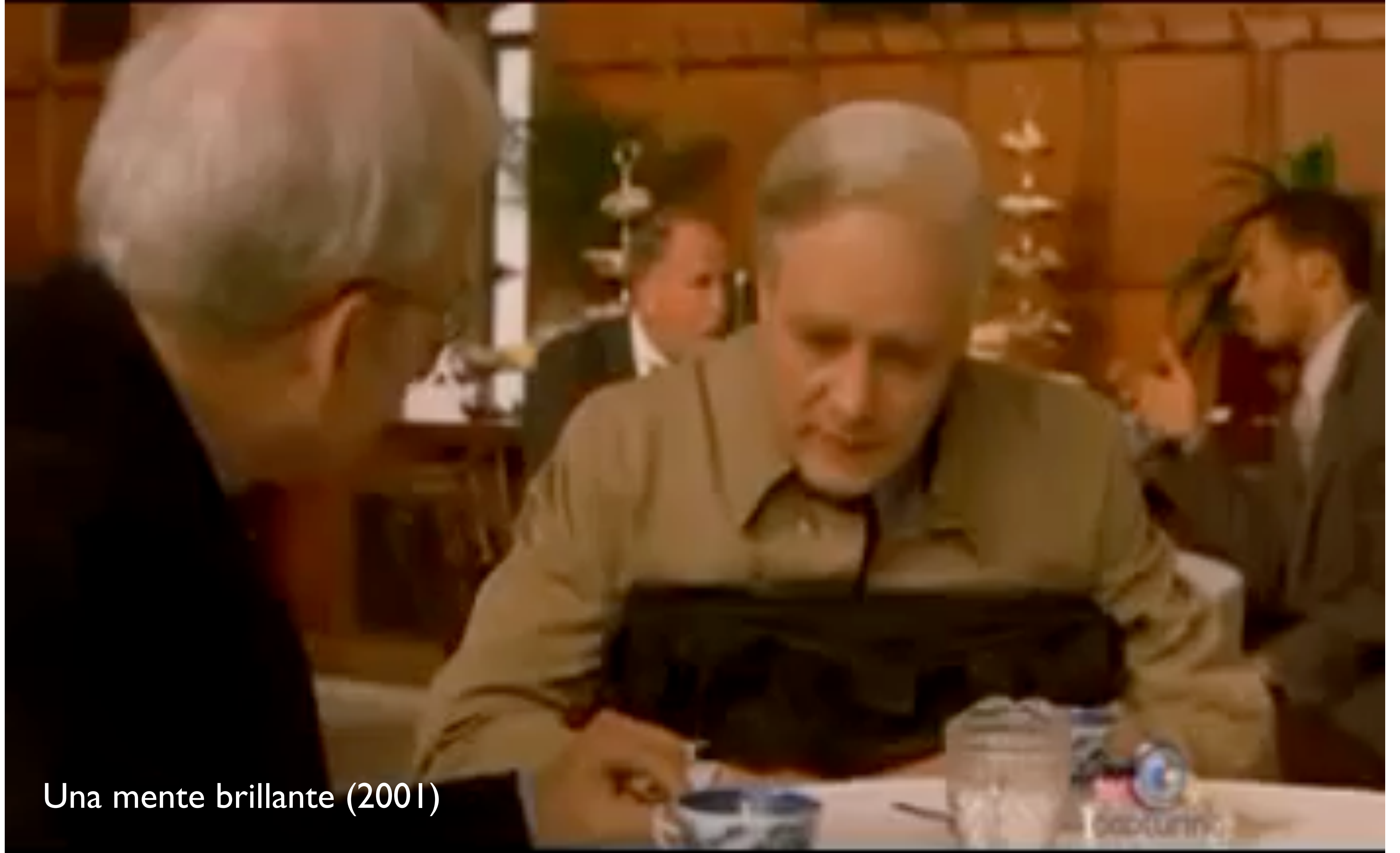
Una mente brillante (2001)